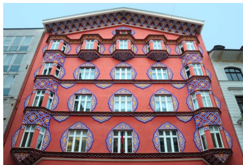
Ancienne banque coopérative